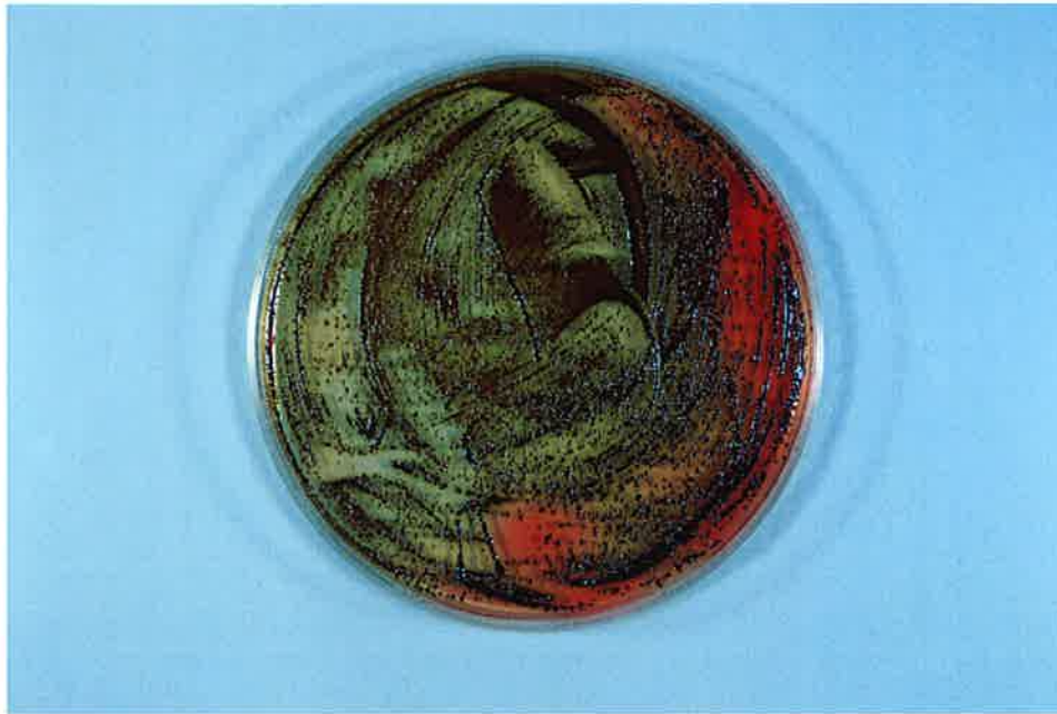
写真-3 ジンジバリス菌 対照 1分後 (試験液 0.01 mL)