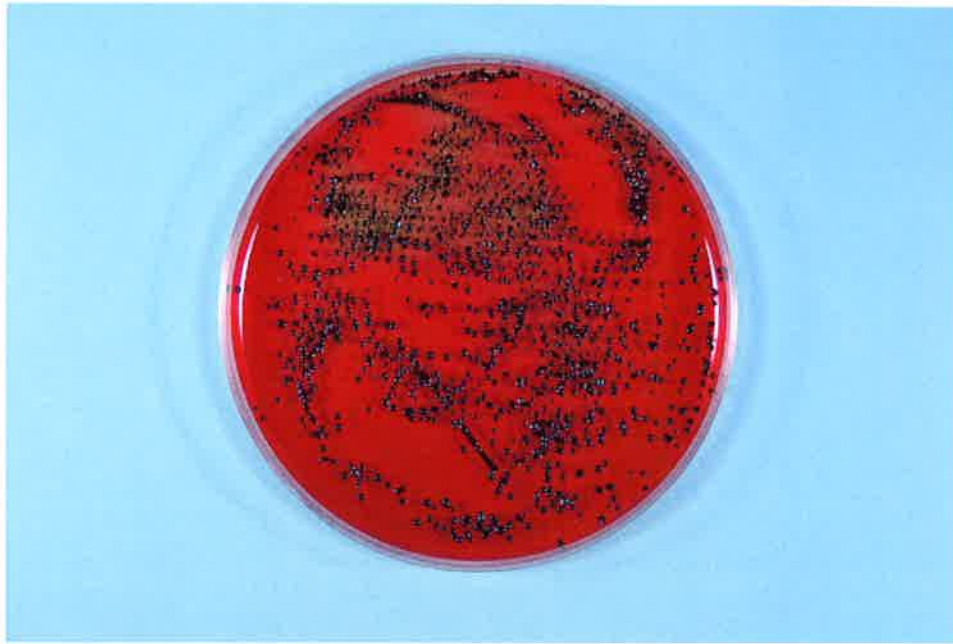
写真-7 ジンジバリス菌 対照 30分後 (試験液 0.01 mL)