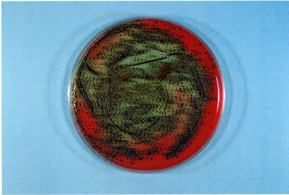
写真-5 ジンジバリス菌 対照 5分後 (試験液 0.01 mL)