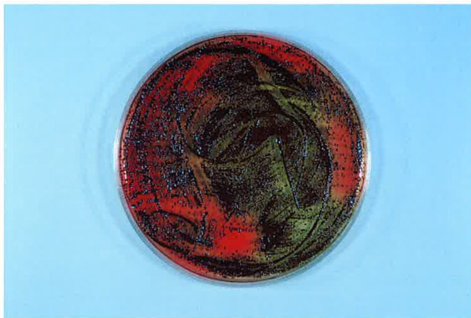
写真-1 ジンジバリス菌 対照 開始時 (試験液 0.01 mL)