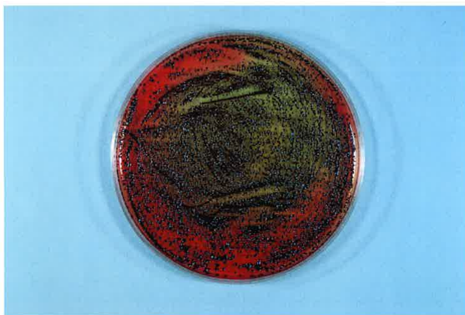
写真-2 ジンジバリス菌 検体 1分後 (試験液 0.01 mL)