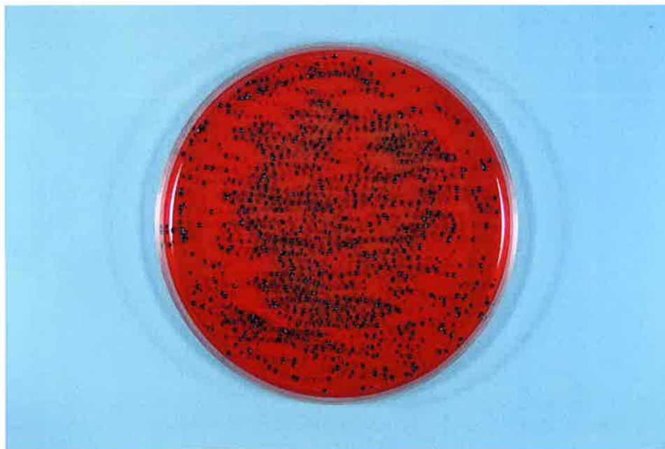
写真-4 ジンジバリス菌 検体 5分後 (試験液 0.01 mL)